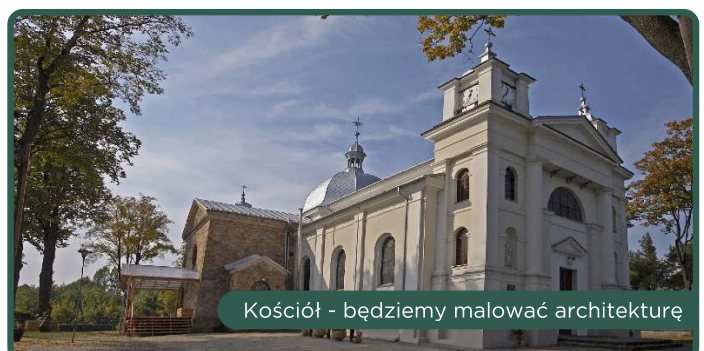
Kościół - będziemy malować architekturę