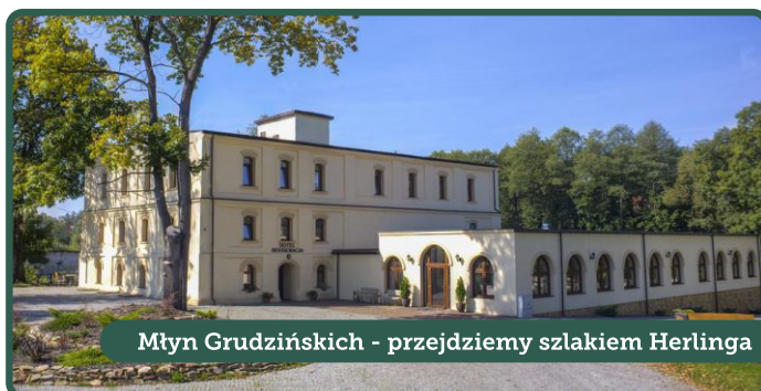
Młyn Grudzińskich - przejdziemy szlakiem Herlinga