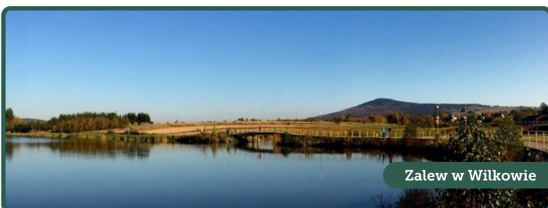
Zalew w Wilkowie