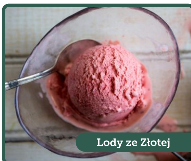
Lody ze Złotej