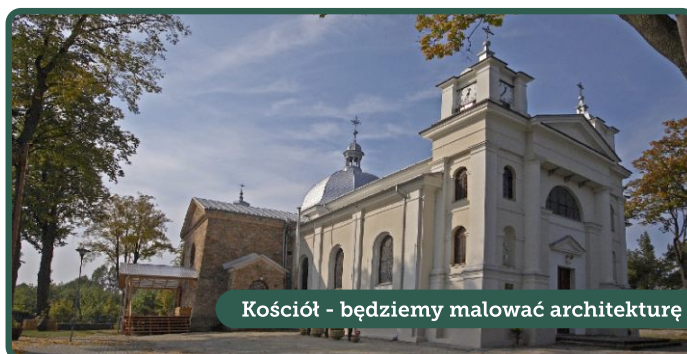
Kościół - będziemy malować architekturę