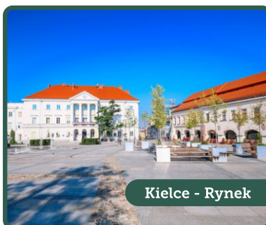
Kielce - Rynek