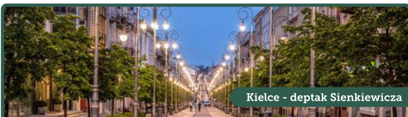
Kielce - deptak Sienkiewicza